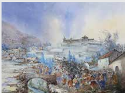
Carnaval Zenobio Orlando Palomino Huamán Ayacucho Participante Premio Horacio Zeballos Gámez 2018

Construcción de riqueza, fabricando un simulador oleohidráulico en el IESTTP AACD