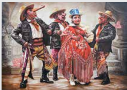
Traje de la danza majeña de Paucartambo - Cusco

Colegio de Alto Rendimiento - COAR, de Huancavelica Aprendiendo a producir textos mejoro mi comprensión lectora